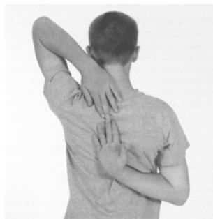
Figure A4-2 Left Shoulder Stretch / Étirement de la coiffe des rotateurs de l'épaule gauche

Note. From Fitnessgram / Activitygram: Test Administration Manual (3rd ed.) (p. 92), by The Cooper Institute, 2005, Windsor, ON: Human Kinetics. Copyright 2005 by The Cooper Institute. / Remarque : Tiré de Fitnessgram/Activitygram: Test Administration Manual (3rd ed.) (p. 92), par The Cooper Institute, 2005, Windsor, Ont. : Human Kinetics. Copyright 2005 The Cooper Institute.